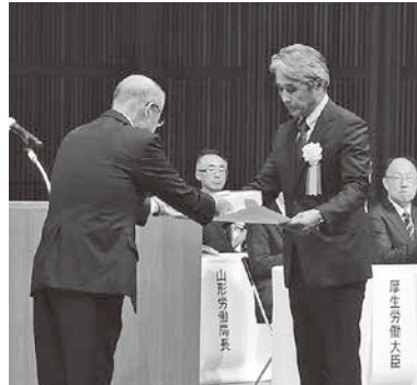
事業場賞進歩賞代表の 東北ウッドカッター株式会社