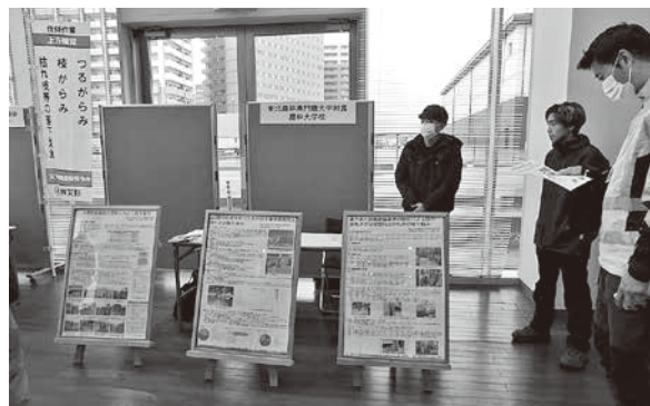
東北農林専門職大学附属農林大学校生によるパネル展示

技能向上のための取組に関するパネル展示を熱心に見学するなど、開会までの時間を有意義に過ごした。会場内では正面の大型ビジョ