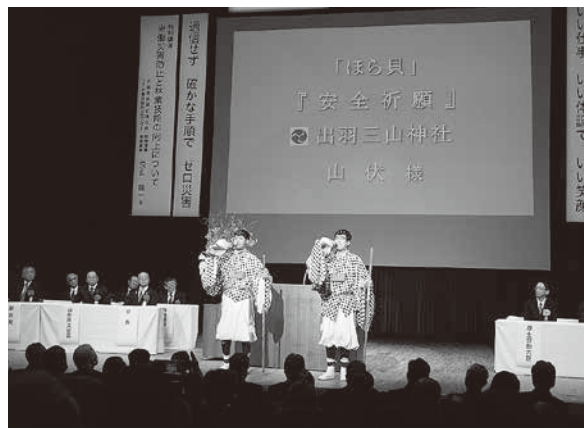
出羽三山神社 山伏によるほら貝の吹鳴